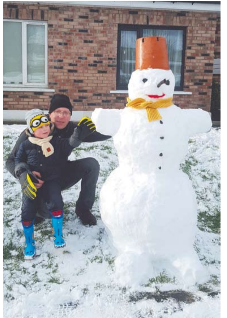
Deimantės Budrės nuotr.