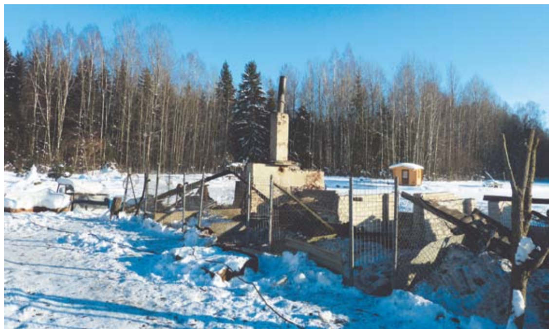
Rašimėlių veislynas įsikūręs atokioje tarpmiškio sodyboje. Vienas iš veislyno pastatų sudegė.