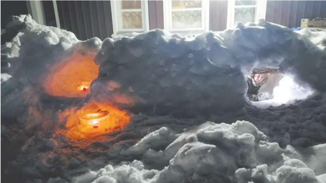
Sūnaus būstinė su ledo žibintu ir Ledo paveikslas.

Nuotraukas skelbkite po šiuo pranešimu naujienų portalo anyksta.lt feisbuke.