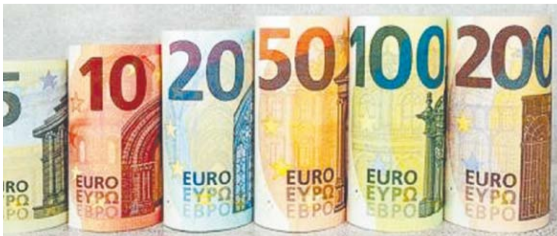
Anykščių rajono savivaldybės biudžetas.