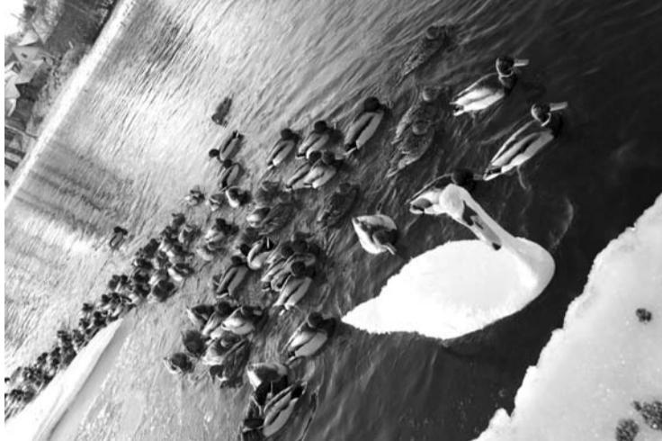
Emigracijos nepakenčiančios Anykščių patiltės antys ir gubės...

Ne vienus metus Lietuvoje nebuvo rimtesnės žiemos, todėl daugiau nei mėnesį sniego patalais užklota žemė ir žemiau 20 laipsnių kritantis termometro stulpelis atrodo grėsmingai. Tačiau gamtininkai dėsto, kad nei gyvūnams, nei augalams situacija kol kas nėra kritinė.