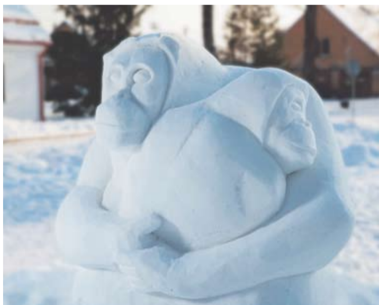
Beveik dviejų metrų aukščio orangutanės su kūdikiu sniego skulptūrą menininkas kūrė dvi dienas ir sunaudojo keturias tonas sniego.

Vytauto Didžiojo universiteto Botanikos sode „apsigyveno“ beveik dviejų metrų aukščio orangutanė mama Eglė, švelniai glaudžianti prie savęs mažylį Ažuolą. Sniego skulptūrą sukūrė Kurklių seniūnijos Vargulių kaime gyvenantis belgų skulptorius René Maria N. Maes.