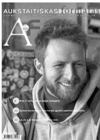
Utenos regionui skirtas informacinis - pramoginis žurnalas „Aukštaitiškas formatas“ leidžiamas jau keturioliktuosius metus.